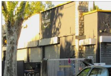
Une réglementation pour les enseignes et publicités sera votée au prochain conseil municipal.

Sur l'ensemble du territoire de la commune, il a été recensé 436 enseignes ou pré-enseignes (dont 292 parallèles aux murs, 27 perpendiculaires, 75 scellés au sol, 40 sur clôtures, 24 % des enseignes et autres sont en infraction à la réglementation nationale). Il y a donc lieu de veiller à la qualité paysagère, (notamment en bordure des RD 554 et 952 qui traversent le village). Les propositions retenues sont de maintenir une faible pression, autoriser avec un impact de sécurité, réduire les dispositifs lumineux, et une bonne intégration architecturale