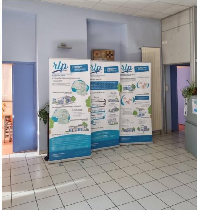
Totems d'expositions en mairie de Vinon-sur-Verdon, 3 mai 2023

Un article a également été rédigé dans la presse locale (Var Matin le 7 mai 2023) afin de présenter la démarche, les grandes lignes du projet et préciser qu'une réunion publique s'est déroulée.